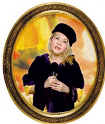
(清海無上師吟唱悠樂詩詞的珍貴近影，攝於2006年。)