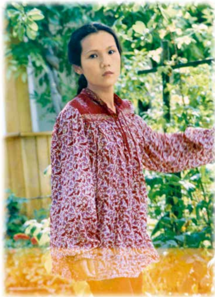
Thanh Hải Vô Thượng Sư tại nhà mẹ chồng ở Đức