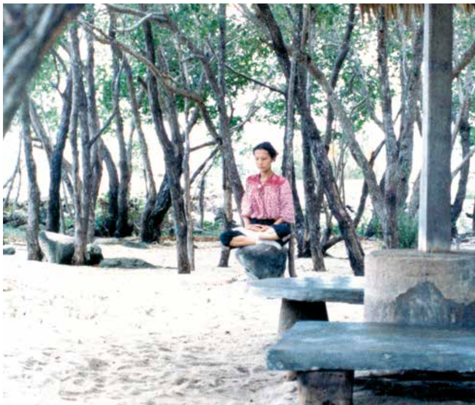
Thanh Hải Vô Thượng Sư ngồi thiền ở Thái Lan