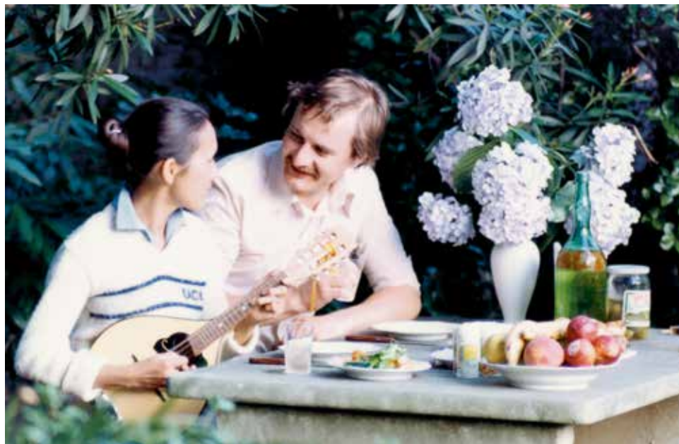
Thanh Hải Võ Thượng Sĩ và phu quân trong kỳ trăng mật tại Rapallo, Ý