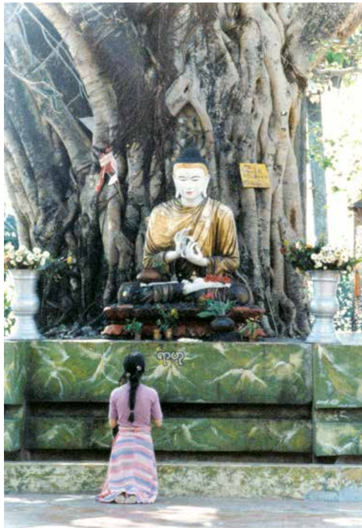
Thanh Hải Vô Thượng Sư hành hương lễ Phật tại Miến Điện