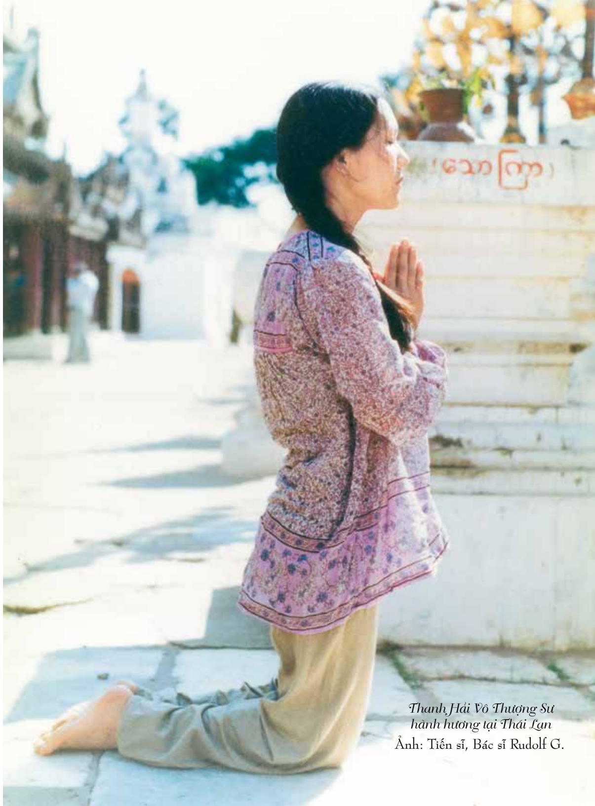
Thanh Hải Vô Thượng Sư hành hương tại Thái Lan