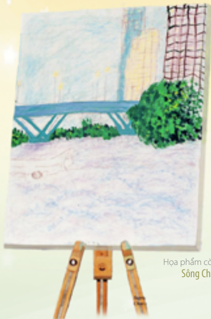
Họa phẩm còn dang dở của Thanh Hải Vô Thượng Sư Sông Chao Praya, Bangkok, Thái Lan – 1996