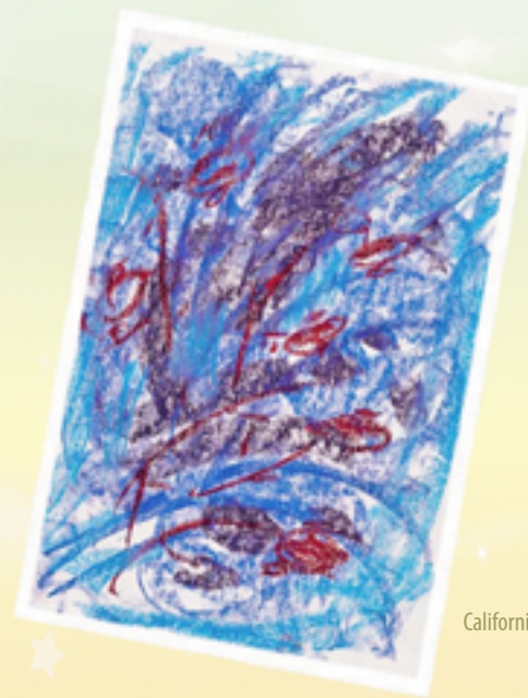
California, Hoa Kỳ – 1997