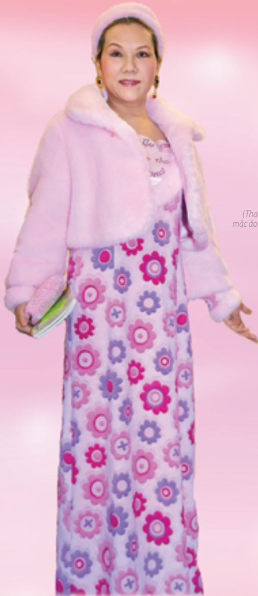
(Thanh Hải Vô Thượng Sư mặc áo lông nhân tạo thực vật)

Nếu toàn thể nhân loại chuyển sang ăn thuần chay thì cả thế giới sẽ hòa bình và Địa Cầu sẽ thay đổi, bởi vì chúng ta đều là minh sư và chúng ta có thể đạt được bất cứ điều gì chúng ta ước. Tuy nhiên phải cẩn thận với điều ước của mình!