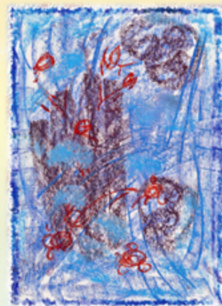
California, Hoa Kỳ – 1997

Hình ảnh và ghi chú được trích từ quyển sách “Nghệ Thuật Thiên Đàng”