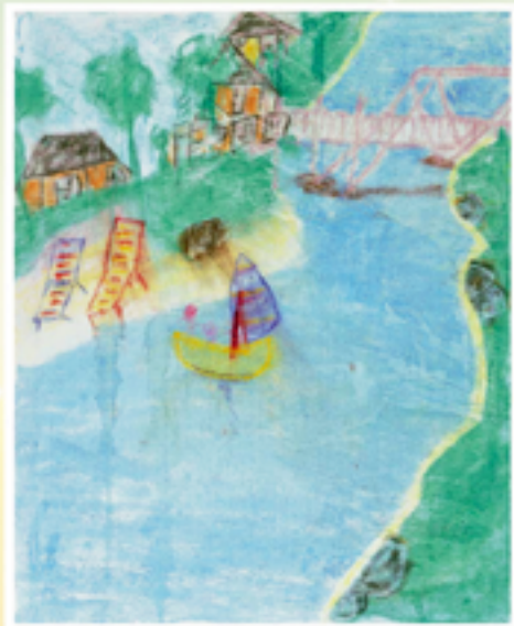
Họa phẩm còn dang dở của Thanh Hải Vô Thượng Sư Khu Dân Cư Ven Hồ – California, Hoa Kỳ – 1997