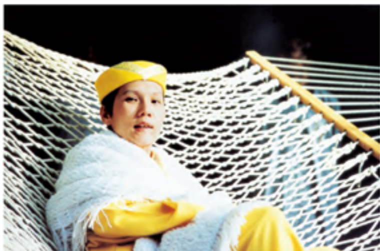
Điều kỳ vọng duy nhất của Thanh Hải Vô Thượng Sư là có thêm một số linh hồn nữa đạt được tự do.

Trích từ bài thuyết giảng "Công Việc Của Bồ Tát Ma Ha Tát"