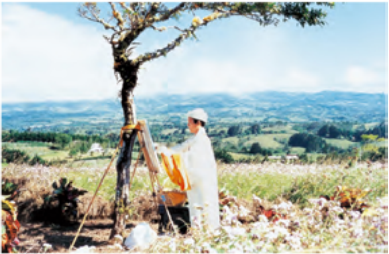
Thanh Hải Vô Thượng Sư thư thái vẽ tranh ở nông trường trước đạo tràng Costa Rica.