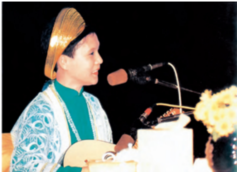
Thời đại khác nhau cần phải dùng phương pháp khác nhau để độ chúng sanh. Trích từ bài thuyết giảng "Thuật Tăng Hành"