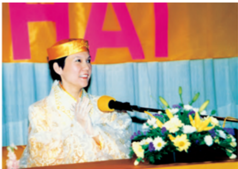
Thanh Hải Vô Thượng Sư thuyết giảng tại Liên Hiệp Quốc lần thứ nhì.