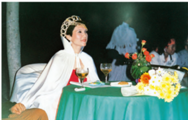
Một vị Minh Sư có rất nhiều phương pháp phi thường, bất khả tư nghị để độ chúng sanh, Thanh Hải Vô Thượng Sư nói: "Khiêu vũ cũng có thể độ người."