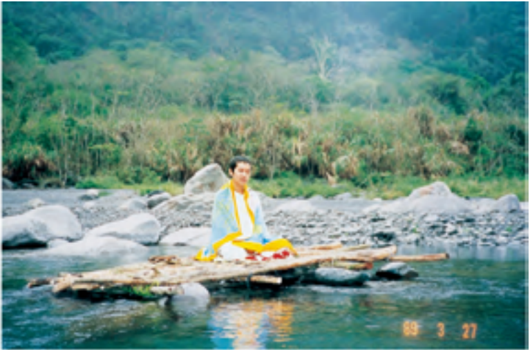
Tu hành càng cao càng đơn giản. Trích từ bài thuyết giảng “Câu Chuyện Về Những Tình Cầu Trong Vũ Trụ”